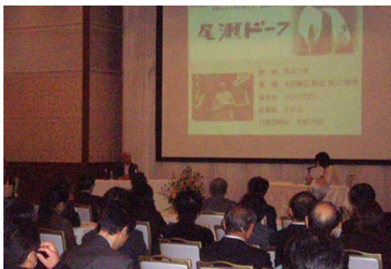
(尾瀬ドーフの事例と対談)