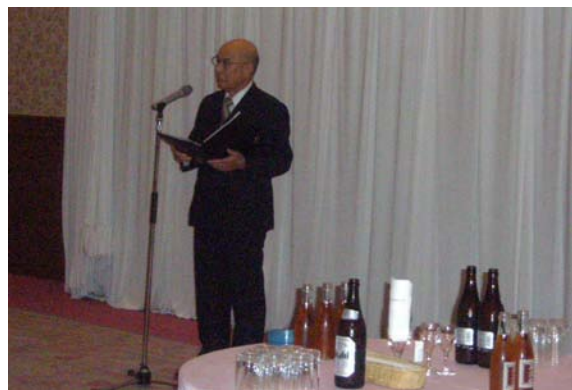
(祝賀交歓会 長塩名誉支部長挨拶)