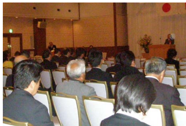
(中小企業診断協会 新井会長祝辞)