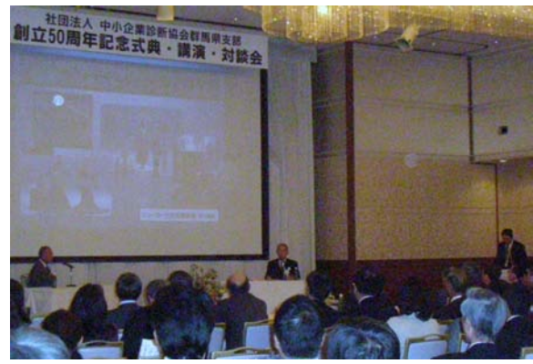
(松井ニット技研の事例と対談)